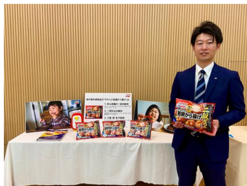
【第14回マザーズセレクション大賞2022 受賞発表会】

今後も当社は、安心・安全でおいしいものづくりを基本とし、商品や取り組みを通じて、生活者に〈感動〉と〈笑顔〉をお届けしていきます。