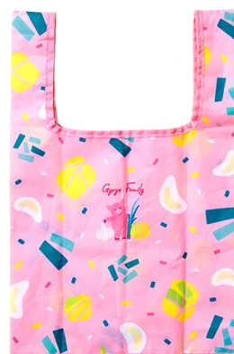
【エコバックデザイン】