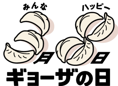
【「ギョーザの日」ロゴ】