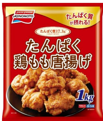
＜たんぱく鶏もも唐揚げ 1kg 袋＞