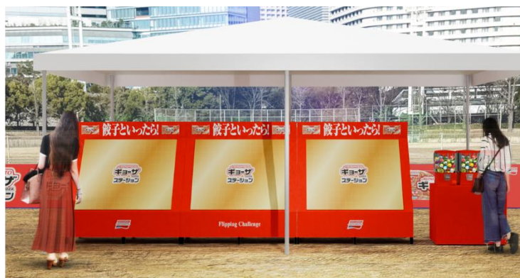
「AJINOMOTO ギョーザ」チャレンジパネル&カプセルトイ

参考 大阪グルメ EXPO 2025 supported by SUNTORY（主催：大阪市） https://www.osaka-gourmet-expo.com