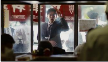
がまんできねえ・・・