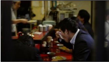
待ってる間の この香り、