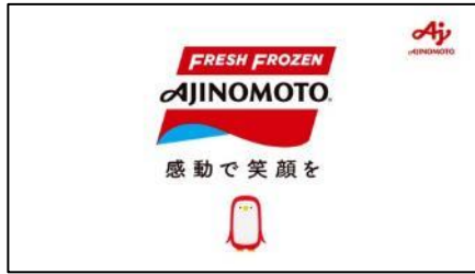
♪ FRESH FROZEN AJINOMOTO