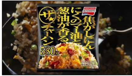
(ナレーション) 食えます。 ザ★チャーハン