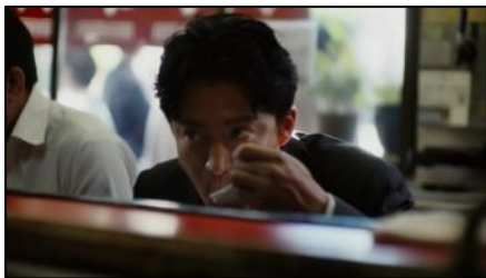
一気に食欲全解放