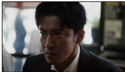
これが家で 食えたなら、