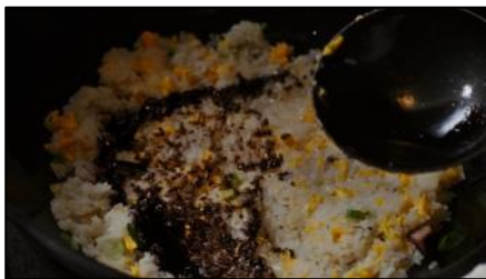
マー油と、 葱油の香りで、