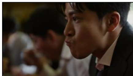
噛んでも、噛んでも