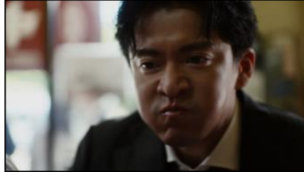
このモグモグがたまらねー