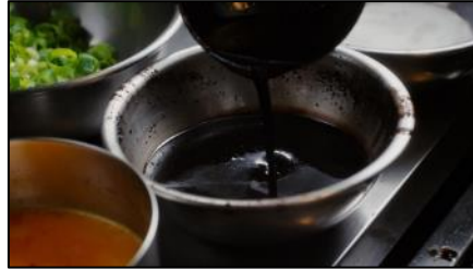
焦がしにんにくのマー油と