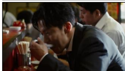
この店のチャーハン