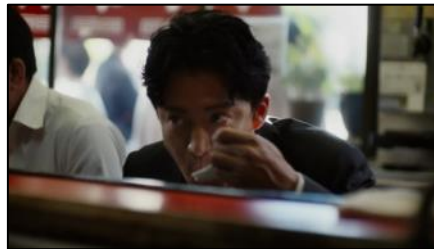
一気に食欲全解放