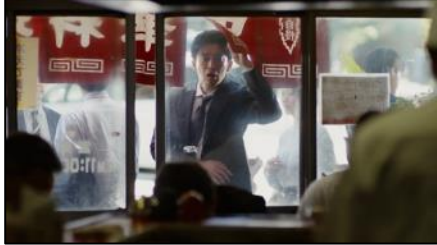
がまんできねえ・・・