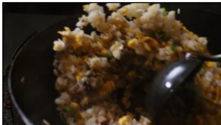
噛んでも、噛んでも