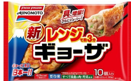
「レンジでギョーザ」(リニューアル品)