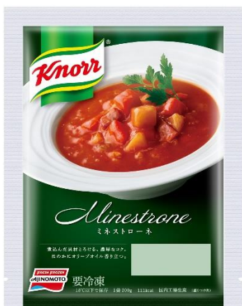
「クノール®」 ミネストローネ