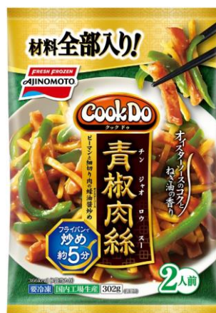
「Cook Do®」青椒肉絲 (新製品/地域限定品)