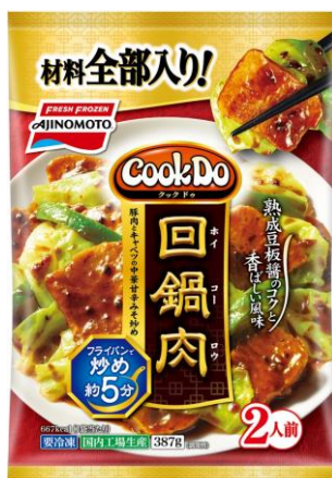
「Cook Do®」回鍋肉 (新製品/地域限定品)

シェフの作り方にない、「Cook Do®」回鍋肉のキャベツは素揚げを行い、「Cook Do®」青椒肉絲の豚肉やピーマンは細切りにするなど、丁寧な下ごしらえから味つけまでこだわっています。ご家庭ではフライパンで炒めるひと手間だけで、手作り料理を楽しみながら簡単においしい中華のメインおかずを作ることができます。