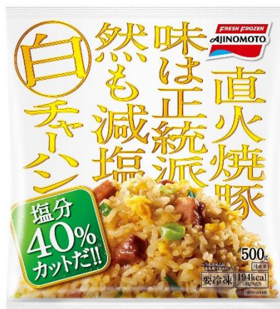
「白チャーハン」 (新製品)