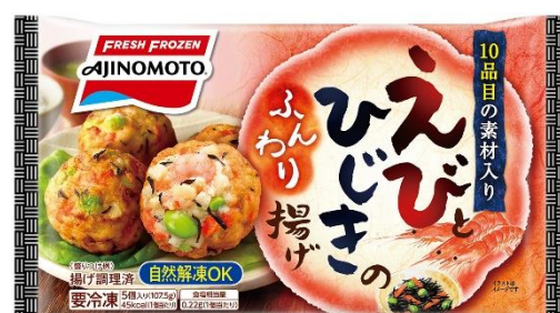
「えびとひじきのふんわり揚げ」 (リニューアル品)