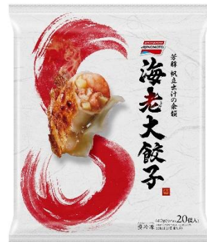
「海老大餃子」 (リニューアル品)