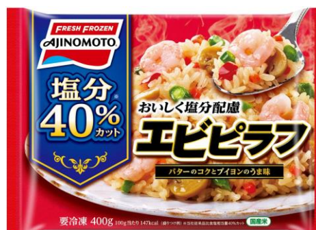
「おいしく塩分配慮エビピラフ」 (新製品)