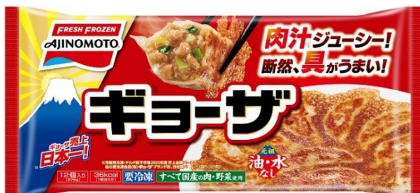
「ギョーザ」 (リニューアル品)

また、電子レンジで約3分調理するだけで、香ばしい焼き目がついた餃子が味わえる「レンジでギョーザ」は、香味野菜の風味やジューシーさ、食べ応えをより感じられるように、中具がさらにおいしくなり、具の量も1個当たり2g増量しました。