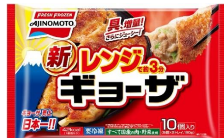
「レンジでギョーザ」 (リニューアル品)