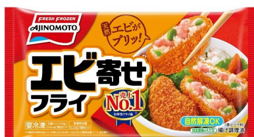
「エビ寄せフライ」 (リニューアル品)

お弁当に入れるおかずとして便利な「エビ寄せフライ」と「えびとひじきのふんわり揚げ」は、おいしさそのままに、それぞれ従来品と比較し塩分に配慮した製品設計にリニューアルします。“毎日食べるものだからこそ、健康に配慮でき、手軽に調理できるものを使って欲しい”という想いから、今回のリニューアルにいたしました。