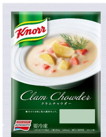
「クノール®」クラムチャウダー (新製品/地域限定品)