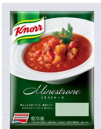
「クノール®」ミネストローネ (新製品/地域限定品)

北海道産野菜をたっぷり使用し、それぞれの野菜の味や風味、彩りを活かした、贅沢な味わいを楽しめる冷凍スープです。「クノール®」ミネストローネは、キャベツ、じゃがいも、にんじんなど、北海道産野菜をたっぷり使用した香り豊かで濃厚な味わいで、オリーブオイルの華やかな香りを立たせ、お店で食べるようなスープの味に仕上げました。「クノール®」クラムチャウダーは、皮つきのじゃがいも、にんじん、乳、帆立貝柱など、北海道産の素材をたっぷり使用した、帆立のうま味と乳の濃厚なコクが溶け込んだクラムチャウダーです。