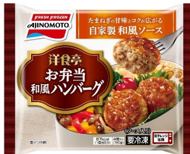
「洋食亭®」お弁当和風ハンバーグ (新製品)

ハンバーグを作る工程にシェフの技を取り入れて本格的な製法で作られた、「洋食亭®」シリーズの新たなラインナップとして「洋食亭®」お弁当和風ハンバーグを発売します。玉ねぎの甘みとコクが溶け込んだ、自家製和風ソース入りです。