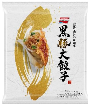
「黒豚大餃子」 (リニューアル品)

「黒豚大餃子」と「海老大餃子」は、紙を一部使用した袋パッケージに変更してリニューアルします。“おうち餃子の最高峰を目指した餃子”という製品コンセプトに合った上質感のある材質にしながらも、従来品比で約36%※のプラスチック使用量の削減を見込んでいます（※当社調べ）。