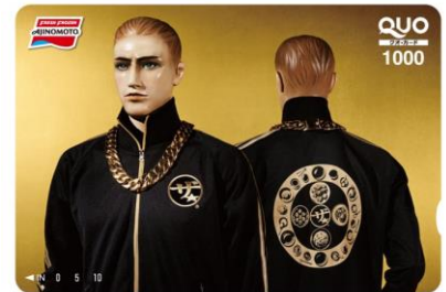
「ザ★®」オリジナル QUO カード （1,000 円分） 100 名様

【当選発表】 当選された方には、2023 年 6 月中旬～下旬に、応募時に使用された Twitter アカウントへの DM（ダイレクトメッセージ）にて当選通知と発送先登録フォーム URL をお送りします。