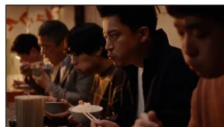
(小栗さん) のみ込むのがもったいねえ。