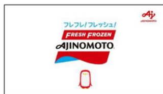
♪ FRESH FROZEN AJINOMOTO