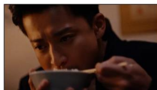
(小栗さん) 口の中をごちゃまぜにする。