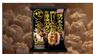
(ナレーション) 今夜食卓で。 「ザ★®シュウマイ」