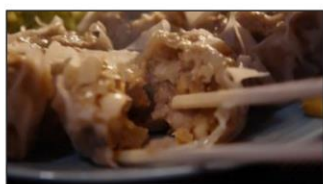
(小栗さん) 噛むたびに肉のうま味。