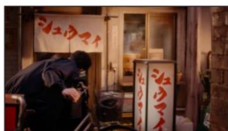
(小栗さん) なんだこの店。