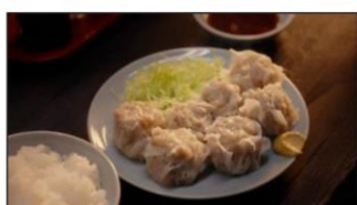
(小栗さん) シュウマイと白飯。