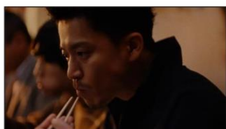
(小栗さん) 豚肉と筍と白飯で