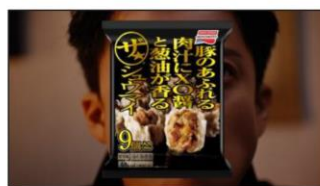
(ナレーション) 食えます。