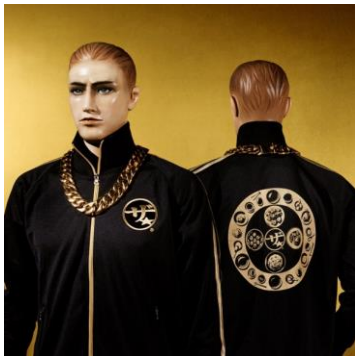
「ザ★®」ジャージ 100 名様