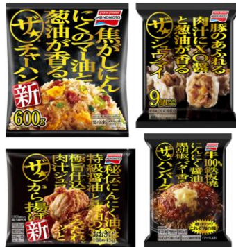
「ザ★®」商品詰め合わせ （「ザ★®チャーハン」「ザ★®シュウマイ」 「ザ★®から揚げ」「ザ★®ハンバーグ」） 100 名様