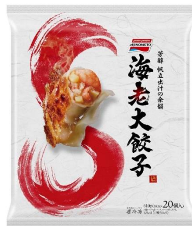
「海老大餃子」 （新製品）