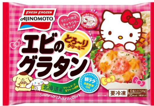
『サンリオキャラクターズ限定パッケージ』

味の素冷凍食品株式会社（社長：黒崎正吉 本社：東京都中央区）は、人気のサンリオキャラクターズ（「ハローキティ」、「ポムポムプリン」、「シナモロール」）とコラボレーションした「カップに入ったエビのグラタン」の期間限定パッケージ（全1種）を、2020年4月上旬より約2ヵ月間の期間限定で販売します。