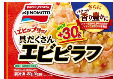
「具だくさんエビピラフ」