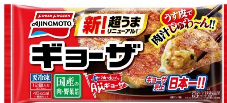
「ギョーザ」(リニューアル品)

2018年秋季にリニューアルした「ギョーザ」と新品种として登場した「しょうがギョーザ」のパッケージをリニューアルし、それぞれの商品の良さを訴求強化を行います。