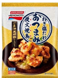
「炭火烧鳥 ねぎ塩だれ」 (新製品)

当社調査では、成人人口の約35%が週1回以上家飲みをしていることがわかっており、今後一層、家飲みの需要は高まると見込んでいます。家でくつろぎながら、お酒に合うおいしいおつまみを味わいたいというニーズにお応えするべく、つついとお酒が進んでしまう味つけで、なじみがあるメニューをおつまみ品種として3品、「炭火烧鳥 ねぎ塩だれ」「チャーシュー餃子」「ひと口焼売」を発売します。