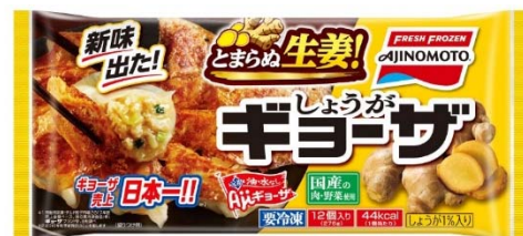
「しょうがギョーザ」(リニューアル品)

当社の「ギョーザ」は、油・水なしで誰が調理してもきれいなパリッパリの羽根ができる餃子で、2003年度以降15年連続で冷凍食品単品売上No. 1の座を保持しています。2018年秋季には、その「ギョーザ」をさらにおいしく進化させるとともに、いつも食べたい餃子のもうひとつの定番として新品种「しょうがギョーザ」を新発売しました。2018年10月の冷凍食品単品売上ランキングでは、「ギョーザ」は不動のNo. 1、「しょうがギョーザ」は新発売ながら8位にランクインし（当社調べ）、お客様からも大好評です。