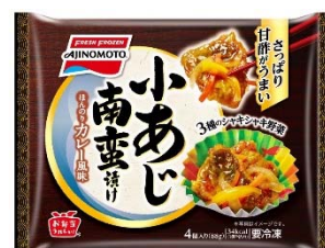
「小あじ南蛮漬け」 (新製品)

この生活者のニーズにお応えして、手作りでは手間のかかるメニューで、お弁当/食卓/おつまみと食シーンを広げる便利なおかずであり、さらに魚と野菜も入った「小あじ南蛮漬け」を新発売します。（※エリア限定販売）