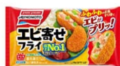
「エビ寄せフライ」 (リニューアル品)