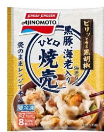
「ひと口焼売」 (新製品)