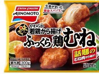
「味からっ」やわらか若鶏から揚げ <ふっくら鶏むね>（リニューアル品）

2017年度の鶏もも肉の冷凍から揚げ市場は約450億円で、2010年度比で161%と大幅に伸長しています。また、鶏むね肉の潜在冷凍から揚げ市場は約174億円で大きく、どちらの市場も高いポテンシャルがあると見込んでいます。（当社調べ）