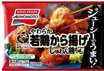
「味からっ」やわらか若鶏から揚げ <じゅわん鶏もも>（リニューアル品）

「味からっ」やわらか若鶏から揚げ<じゅわん鶏もも>は、“黄金スパイス”がきいて、ジューシーであることを訴求するパッケージへリニューアルします。また、「味からっ」やわらか若鶏から揚げ<ふっくら鶏むね>は、衣の揚げ色を濃くし、よりうす衣で軽い食感に仕上げ、さらにおいしくリニューアルするとともに、健康イメージで話題の鶏むね肉を使用していることを強調するパッケージに変更します。