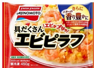
「具だくさんエビピラフ」 (リニューアル品)

また<ボリュームたっぷりのしっかり味のごはん>のニーズにぴったりの「ザ★チャーハン」は、大満足の600gのボリュームと焦がしにんにくのマー油、葱油の食欲そそる香ばしさで、一心不乱に食べきるうまさ、この2つの特長がより伝わるパッケージにリニューアルします。