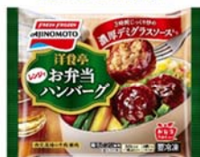
「洋食亭®お弁当ハンバーグ」 (リニューアル品)