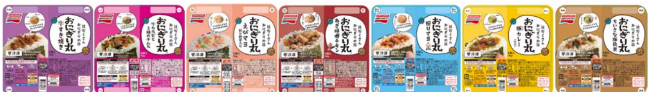
<「おにぎり丸®」製品ラインナップ（既存品）>

当社は今後も定期的に追加品種を発売してバラエティを充実させ、「おにぎり丸®」シリーズの一層の市場定着を図ります。