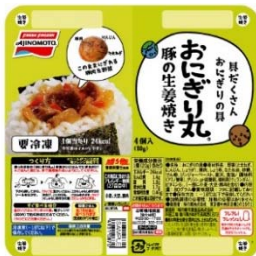
「おにぎり丸®」 豚の生姜焼き （新製品）

お肉と野菜と一緒に取れる栄養バランスが考えられたおにぎりの具「おにぎり丸®」シリーズから、お客様のリクエストによって生まれた「おにぎり丸®」<豚の生姜焼き>を新発売します。また、人気の<鶏の梅あえ>は“紀州梅”を使用していることがより分かりやすいパッケージにリニューアルします。