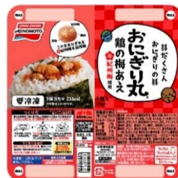
「おにぎり丸®」 鶏の梅あえ （リニューアル品）

当社の「おにぎり丸®」は、<おなじみのおかずでおにぎりが作れ、おにぎり1つでお肉と野菜と一緒に取れる>と大変ご好評をいただいています。2018年2月のリニューアルを機にリピート率は前年比123%と伸長 ※1 し、累計販売個数は約2000万個 ※2 を突破するなど、ますますファンが増加しています。また、購入率は2.6% ※3 と伸びしろがあり、今後も市場が拡大する見込みです。