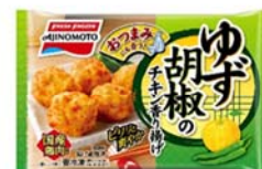
「ゆず胡椒のチキン香り揚げ」 (リニューアル品)