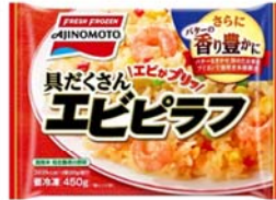
具だくさんエビピラフ (リニューアル品)