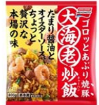
大海老炒飯 (既存品)