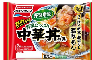
「野菜たっぷり中華丼の具 2個入り」 (リニューアル品)

そこで今回、野菜を増量（当社従来品比5%増量）し、さらに1皿でお肉と野菜が摂取できるよう豚肉を加えてリニューアルすることでお客様の満足度を高め、市場拡大を牽引します。