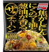
ザ★チャーハン (リニューアル品)