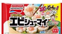
「プリプリのエビシューマイ」 (リニューアル品)