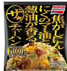
「ザ★チャーハン」 (リニューアル品)

上記に加え、<具を楽しむ、ちょっと贅沢な本場の味のごはん>として「大海老炒飯」（既存品）をご提案し、幅広いターゲットのそれぞれのニーズに応える製品をラインナップすることで、米飯市場のさらなる活性化に繋がります。