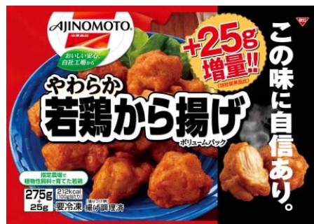
「やわらか若鶏から揚げ ポリュームパック」