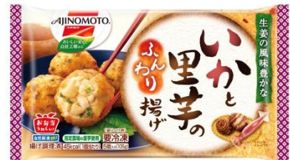
「いかと里芋のふんわり揚げ」（新製品）

栄養バランスを気にかけているお客様の気持ちにお応えし、野菜を使った<体にやさしいお弁当のおかず>の品揃えを強化します。いかと里芋をふんわりとした白身魚で包んで揚げた「いかと里芋のふんわり揚げ」（新製品）を発売します。