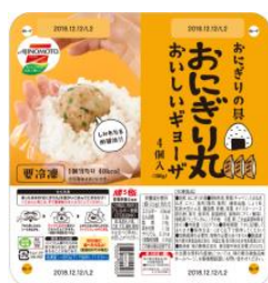
「おいしいギョーザ」