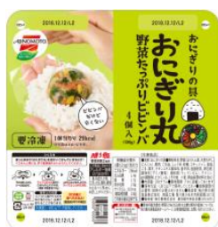
「野菜たっぷりビビンバ」