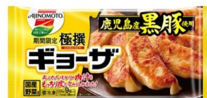
「極撰ギョーザ」（再発売品）

当社は2016年の夏に、鹿児島県産黒豚と国産野菜を使用し、あふれんばかりの肉汁をもっちりとした皮で包みこんだ「極撰ギョーザ」（再発売品）を期間限定で発売、ビールを組み合わせた売り場提案を行い、大変ご好評いただきました。そこで、今年も夏の需要期に合わせ、「極撰ギョーザ」を期間限定発売し、夏の売り場を一層盛り上げ市場の活性化を図ります。