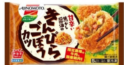
「きんぴらごぼうカツ」（新製品）

お弁当の作り手のニーズである<おいしさ>や<品質のよさ>、食べ手のニーズであるお弁当の時間に<ワクワクするような楽しさが欲しい>という思いに応えて、栄養豊富なきんぴらごぼうとお肉がぎっしり入った甘辛い焦がし醤油味の「きんぴらごぼうカツ」（新製品）を発売します。