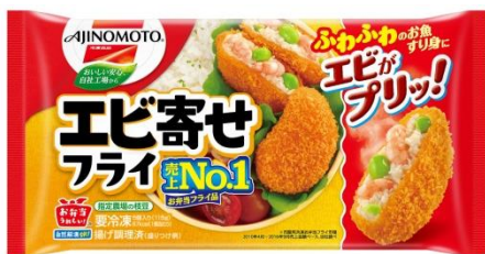
「エビ寄せフライ」（リニューアル品）

※ 市販用冷凍お弁当フライ市場 2010年4月～2016年9月売上金額ベース、当社調べ。