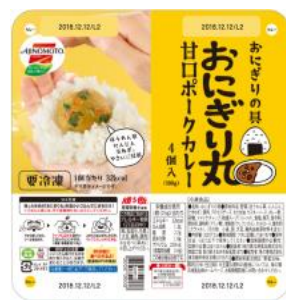
「甘口ポーークカレー」

「おにぎり丸」は、これまでおにぎりの具にすることが難しかったカレー、ビビンバ、餃子、豚角煮、麻婆豆腐といったメニューを豊富に取り揃えました。「おにぎり丸」はごはんになじんで食感はしっとりとなめらか。本製品を凍ったまま温かいごはんと一緒に握れば、ごはんの粗熱で解凍され、食べやすくおいしいおにぎりができあがります。子どもの部活中の昼食や間食、塾前食や夜食としてもご利用いただけます。（別紙プレスリリース参照）