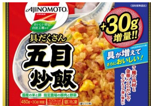
「具たくさん五目炒飯」