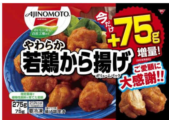
やわらか若鶏から揚げ ボリュームパック