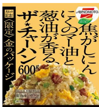
＜限定＞パッケージ画像

2015年秋季の発売以降、お客様に大変ご好評いただいた「ザ・チャーハン」の大ヒット記念とお客様への感謝の気持ちを、特別感のある金色地のパッケージデザインで表現し、さらなる売上拡大を目指すとともに、冷凍食品市場の活性化を図ります。