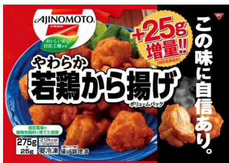
「やわらか若鶏から揚げ ポリュームパック」