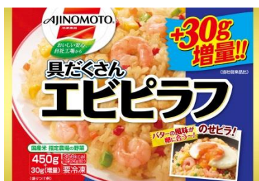
「具たくさんエビピラフ」