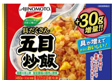
「具たくさん五目炒飯」